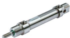
ISO 6432 roestvaststaal cilinder, diameters 16 tot 25 mm

ISO 6432 stainless steel cylinders, diameters from 16 to 25 mm