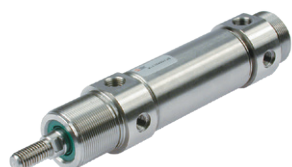
Roestvaststalen rondcilinder, diameters 32 tot 63 mm

Pressure regulators for drinking water, BIT Series F, 1/8" and 1/4" connections