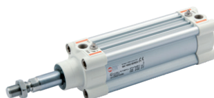
ISO 15552 cilinder type HCR, hoge corrosiebestendigheid, diameters 32 tot 125 mm

ISO 6432 stainless steel cylinders, diameters from 16 to 25 mm