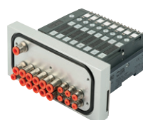
Ventieleiland voor spatwater omgeving. Serie HDM, EB 80 4 tot 16 ventielspoelen

Round stainless steel cylinders, diameters from 32 to 63 mm